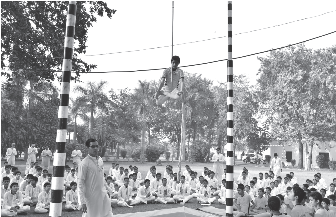
रस्से पर योगासन प्रदर्शन