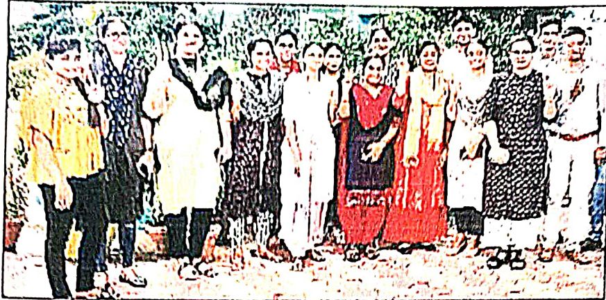
महेन्द्रगढ़। जश्न मनाते विद्यार्थी व कालेज स्टाफ।

नलगा। हसस सगा आगाणा न सुरा का गाहाल ह तथा उव्हाण हस सड़क का निर्माण मंजूर तारने पर उनका आभार व्यक्त किया है।