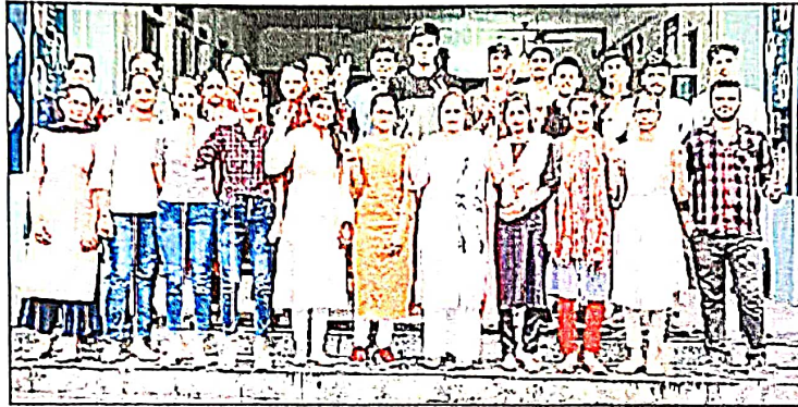
महेंद्रगढ़। जश्न मनाते हुए आरपीएस कॉलेज के विद्यार्थी।