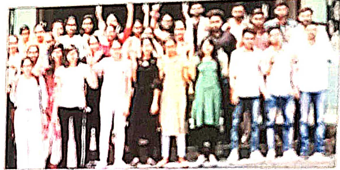
इंदिरा गांधी विद्यापीठ, मरपुर रवड़ा द्वारा आयोजित शालू परीक्षा में छात्रा शालू 92 प्रतिशत अंक लेकर अव्वल रही।