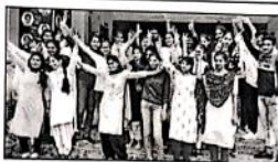
महेंद्रगढ़। रिजल्ट आने पर उत्सवित कॉलेज की छात्रा।

OF NUMBER THREE ऑफिस के रहते आंख जखरी। नगर हंगर